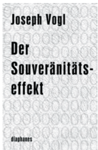
Joseph Vogl: Der Souveränitätseffekt. Zürich: Diaphanes 2015, 320 Seiten, 24,95 €

Ganz und gar nicht spekulativ, sondern beeindruckend kohärent ist Wolfgang Streecks Text „Wie wird der Kapitalismus enden?“ Hier läuft das zusammen, was die anderen Bücher beschreiben, und fügt sich zu einem Bild. Drei Trends macht Streeck seit dem „Ende der Nachkriegsprosperität“ in den siebziger Jahren aus: den Rückgang des wirtschaftlichen Wachstums, die steigende Verschuldung von Staaten, Unternehmen und Privathaushalten und die wachsende Ungleichheit von Einkommen und Vermögen. Diese Entwicklungen ver-