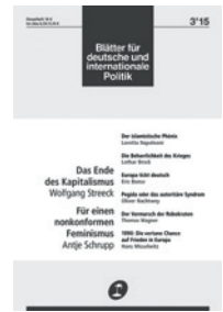
Wolfgang Streeck: Wie wird der Kapitalismus enden? Berlin: Blätter für deutsche und internationale Politik 3/2015, S. 99–111, 3,00 €

Worin Vogl also eine Machtübernahme der Privatwirtschaft sieht, beispielsweise in der Griechenland-Krise, erkennt Streeck ein Symptom des Untergangs. Seine Analyse ist die düsterste der hier besprochenen Texte und gleichzeitig die bestechendste. Die Zukunft muss zeigen, ob die optimistischeren Autoren (Klein, Graeber, Sedlacek) noch Recht behalten. Ob ihre Hoffnung auf die Handlungsfähigkeit der Menschen und damit auf die Formbarkeit des Systems sich erfüllt. Dass wir gegenwärtig nicht nur eine Krise des demokratischen Kapitalismus erleben, sondern einen existenzbedrohenden Niedergang: Nach der Lektüre dieser Texte ist das nur noch schwer zu bestreiten.