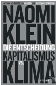
Naomi Klein: Die Entscheidung. Kapitalismus vs. Klima. Frankfurt/M.: S. Fischer 2015, 704 Seiten, 26,99 €

denen der Leidensdruck schon in Widerstand übergegangen ist, an denen sie die Elemente einer solchen umfassenden Vision zu entdecken meint – sei es bei den Gegnern eines Kupfertagebaus in einem griechischen Dorf oder an der kanadischen Pazifik-Küste, wo sich die indigene Bevölkerung gegen eine Pipeline engagiert.