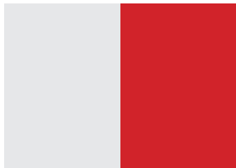
1/1 Seite 175 × 251 mm*