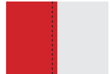
4. Umschlagseite 175 × 251 mm* (Am rechten Rand in einem Korridor von 10 mm sollte keine Schrift stehen, da dort aufgrund der Klebebindung eine leichte Falz läuft.)