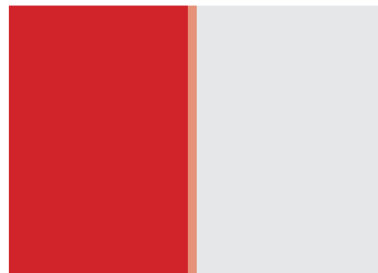
2. Umschlagseite 175 × 251 mm* (Durch Klebebindung werden 5 mm verdeckt.)